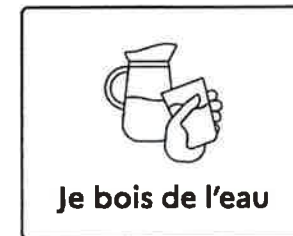
Je bois de l'eau