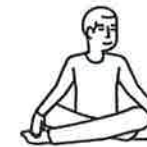
Je fais des activités sans effort