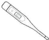
Fièvre > 38°C