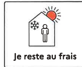
Je reste au frais