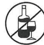
J'évite de boire de l'alcool