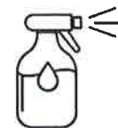
Je mouille mon corps